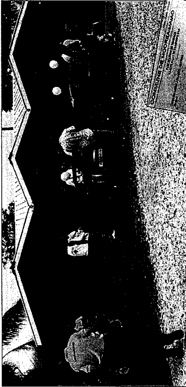
L'entrée de la salle des mariages était sous bonne garde.

lé sans heurts, si ce n'est quelques cris de protestation, et de la musique traditionnelle provenant des voitures des militants. Après une petite demi-heure, des applaudissements se sont fait entendre. Les futurs mariés s'étaient dit "oui" !